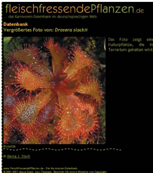
<--- Abb. 1.6: Das vergrößerte Foto. Auf der rechten Seite die Beschreibung, unterhalb vom Bild der Kurztitel.