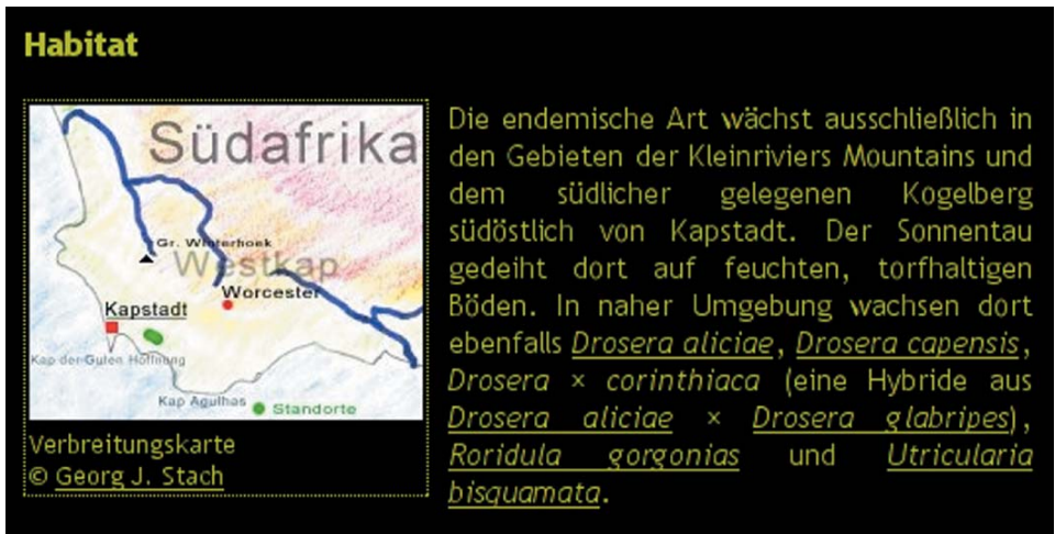
Abb. 13: Die Datei wurde in den Beschreibungstext eingefügt und wie angegeben links ausgerichtet, unter dem Bild der Beschreibungstext, darunter die Copyright-Angabe, die mit Hilfe der GFP-Mitgliedschaftsnummer eingetragen wurde.

Das Ergebnis nach Aktualisierung des Datensatzes: