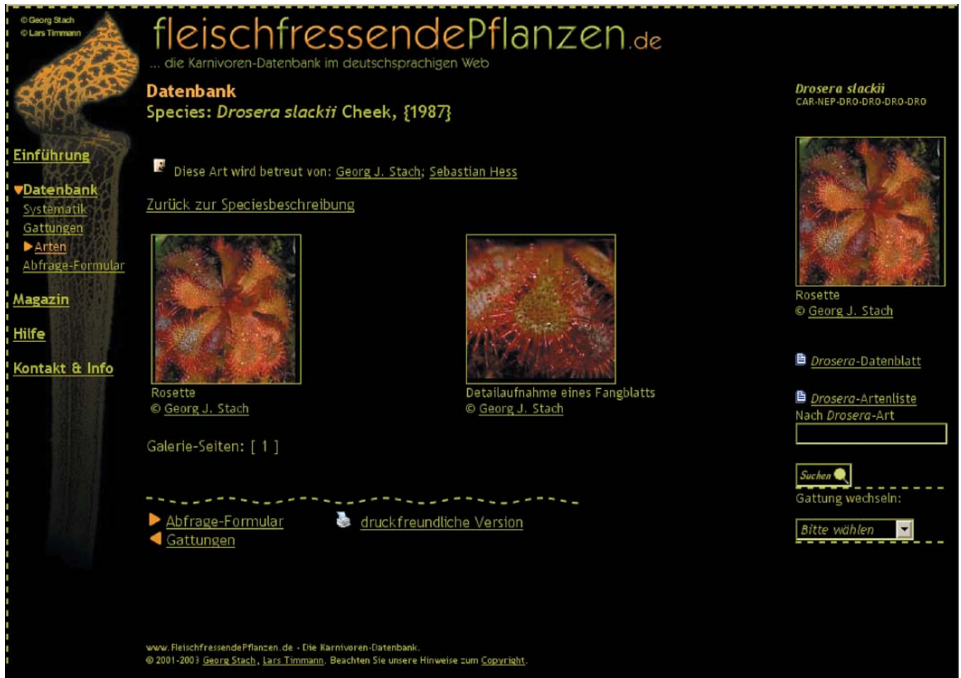
Abb. 15: Die Galerie von D. slackii mit zwei Fotos auf FleischfressendePflanzen.de. Die verkleinerten Bilder lassen sich anklicken. Es wird dann eine vergrößerte Version mitsamt Beschreibung angezeigt (Abb. 1.6)